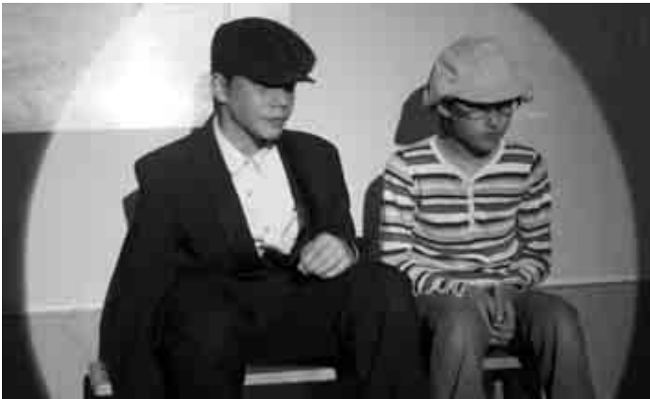
Die Aufführungen von «Emil und die Detektive» waren ein voller Erfolg.

Im Januar und Februar galt es, Rollen auszusuchen, Kolleginnen und Kollegen zum Mitspielen anzuregen, Ideen für Requisiten, Kulissen und Bühnengestaltung zu suchen, Film- und Fotoaufnahmen in St. Gallen zu machen, Leseproben und Szenenproben durchzuführen, Szenen zu streichen sowie noch und noch Texte zu kürzen. Im März und April standen auf dem Programm: Film-, Foto- und Tonbandaufnahmen auf dem Schulhausplatz, in St. Gallen, in Rorschach und in Horn machen, Film- und Fotoausschnitte auswählen, Hintergrundprojektion mit