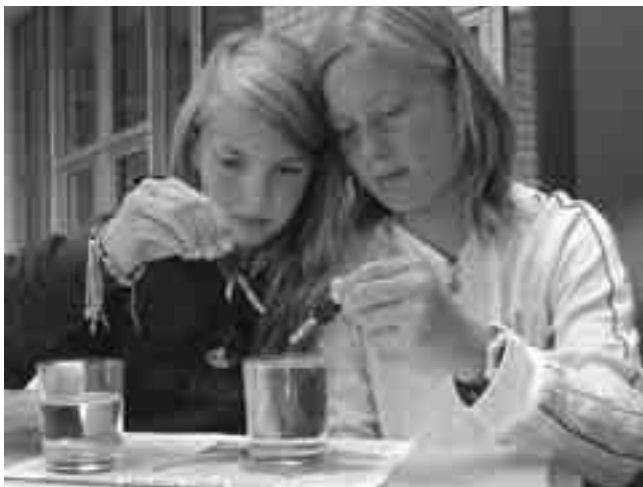
An der Pressevorstellung des neuen Lehrmittels «Kreislauf des Wassers» experimentierten viele Jugendliche mit Aufträgen aus dem Lehrmittel. Diese zwei Mädchen testen die Oberflächenspannung von Wasser.

Als Ergänzung zu den sechs Geschichten für den Sprachunterricht erschien nun «Die Linda-Klasse in der Freizeit». In 28 Episoden erlebt man die Kinder in Alltagssituationen im Unterricht wie auch zu Hause oder in den Ferien.