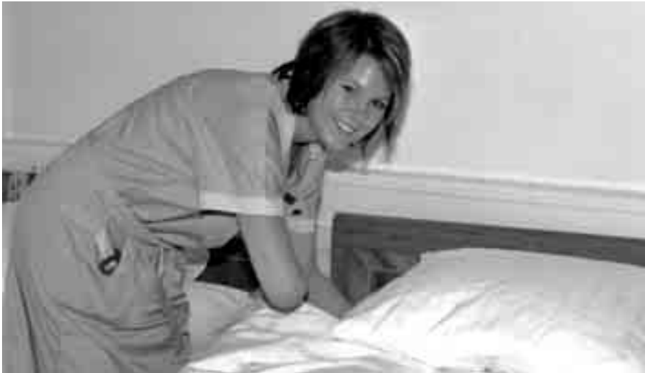
Auszubildende in der Klinik Schloss Mammern in den Bereichen Hotellerie und Küche