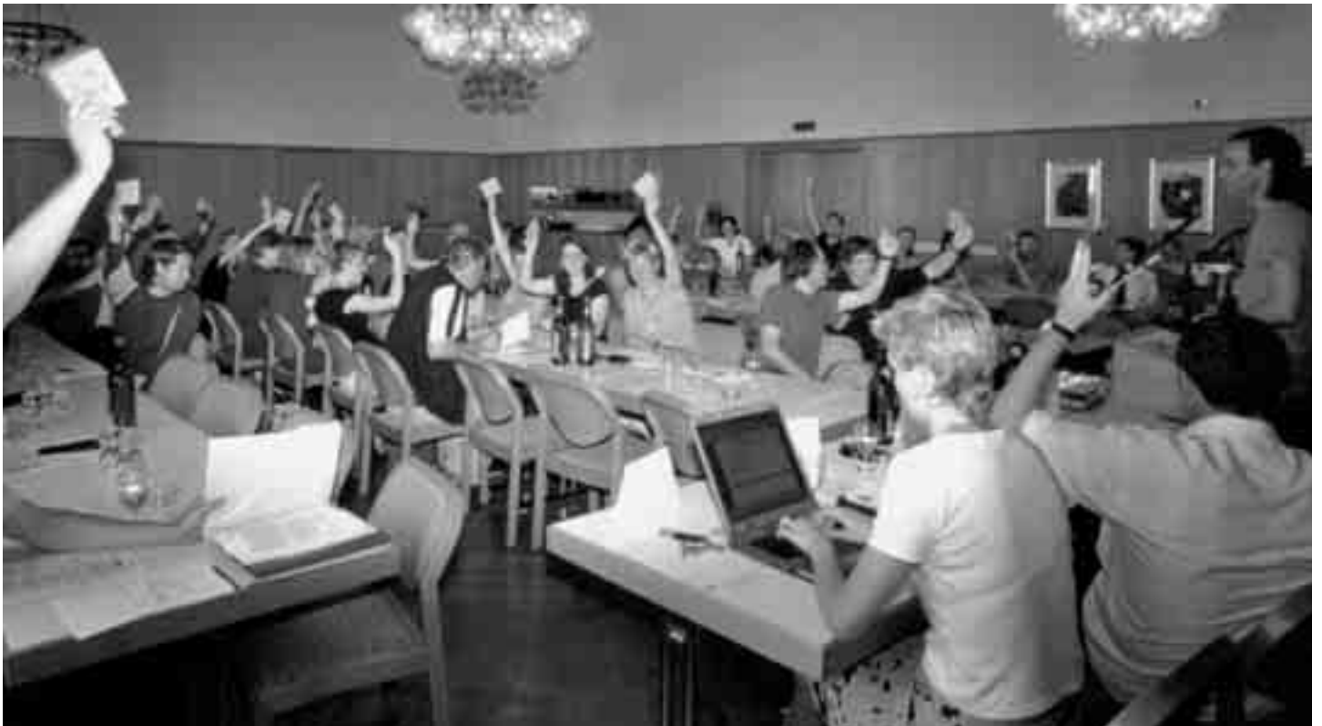
Die Delegierten befürworteten einstimmig Ende Mai 2005 den Entwurf für die neuen Verbandsstatuten von «Bildung Thurgau».

dass die Kostenentwicklung nicht auf dem Rücken der Lehrerinnen und Lehrer gebremst werden kann. Wir scheinen nun an eine Schwelle gekommen zu sein, wo der Leistungskatalog der Schule neu diskutiert werden muss, damit unsere Bildung einerseits bezahlbar bleibt, aber nicht durch heftige Sparmassnahmen in einer Zweiklassenbildung auszufert. Eine erste Sparwelle hat nun die Mittelschulen erreicht, eine weitere wird an der Volksschule nicht auszuschliessen sein. Die Kosten für unsere Bildung werden eine Herausforderung für die Lehrer-