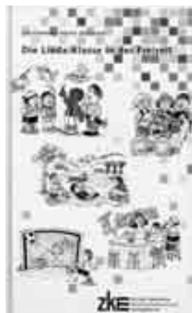
«Die Linda-Klasse in der Freizeit», Leo Eisenring und Martin Steinauer, Bestellnummer 199 bei zkm, 28 Franken, ab 15 Exemplaren 21 Franken

Die Geschichten sind sehr süffig zu lesen, regen manchmal zum Schmunzeln an, stimmen oft aber auch nachdenklich. Das Buch eignet sich gut als Klassenlektüre, unabhängig davon, ob man mit dem eigentlichen Sprachlehrmittel gearbeitet hat oder nicht.