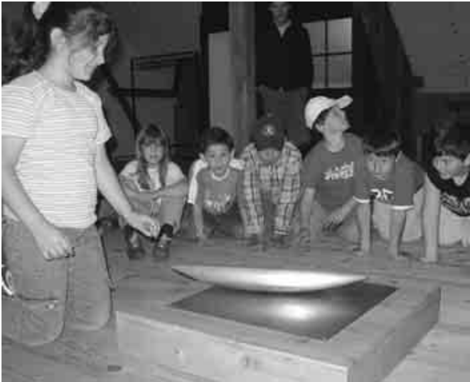
Der Wackelstein aus Aluminium ruft bei den Betrachtenden Staunen hervor, wenn er ganz unverhofft die Drehrichtung wechselt. Unten: Beim blinden Ertasten von verschiedenen Materialien sind der Spürsinn und das Erinnerungsvermögen gefordert.