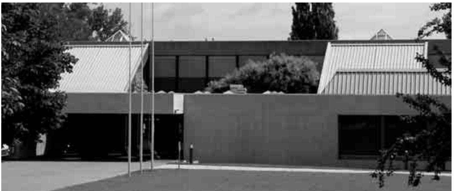
157 Schülerinnen und Schüler nahmen am 15. August 2005 in Romanshorn die Ausbildung an der Fachmittelschule in Angriff.

Weitere Informationen zur Fachmittelschule findet man unter « www.ksr.ch », « www.ksr.tg.ch », « www.kanti-frauenfeld.ch » und « www.ksf.tg.ch ».