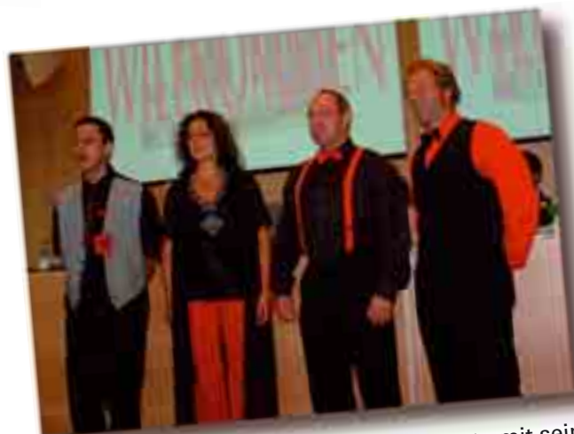
Das Vokalquartett Tschipitujuh bereicherte mit seinen gelungenen A-Cappella-Vorträgen die Gründungsversammlung.