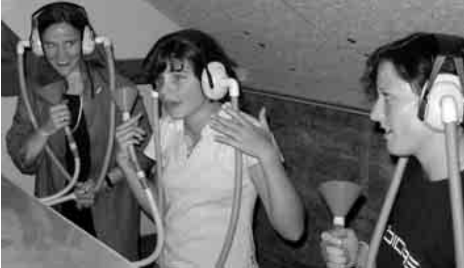
In der Abteilung Hörgerühr sind zur Kommunikation gegenseitige Absprachen sowie das Entwickeln von Strategien notwendig.

sentlich, im Workshop Gelegenheit zu erhalten, die eigenen Sinne im Hier und Jetzt zu spüren. Nach Absprache mit den Lehrpersonen können die Führungen Anregung zur nachfolgenden Vertiefung im Unterricht oder Ab-