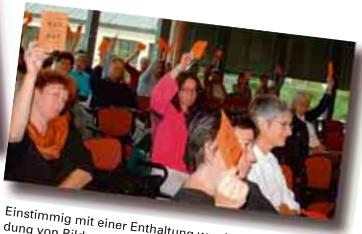
Einstimmig mit einer Enthaltung wurde der Gründung von Bildung Thurgau zugestimmt.